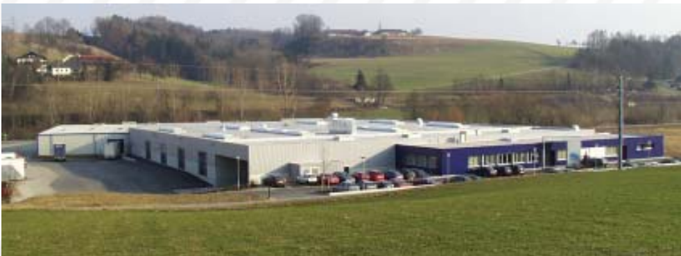
Das neu errichtete Werk der Eurofoam / pactec in Kremsmünster.