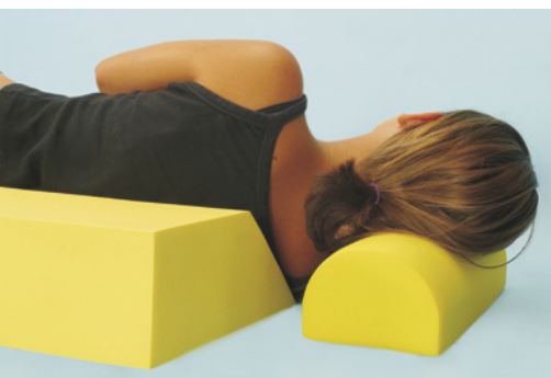
Foam4Care - Seitenlagerung mit Duren Mediline -Teilen.

Polen ist unser wichtigster Markt in Osteuropa. Trotz verschärftem Wettbewerb und der Rezession in Deutschland, Polens wichtigstem Exportmarkt, konnten wir unsere Marktposition festigen und sogar noch weiter ausbauen. Auch in Ungarn konnten wir unsere Marktführung im Bereich der Komfortschäume und technischen Schäume weiter behaupten.