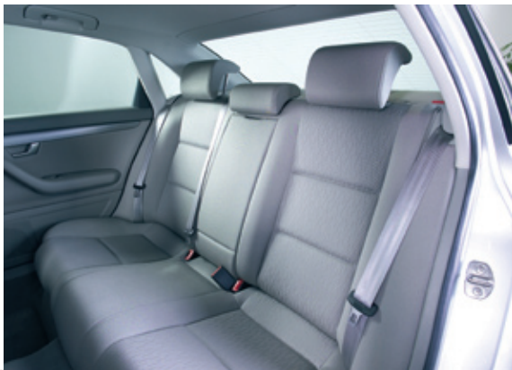
Technische Schaumstoffe für Sitze und Rückenlehnen, Kopfstützen, Mittelarmlehnen, Türseitenverkleidungen und Dachhimmel: Alles aus einer Hand!