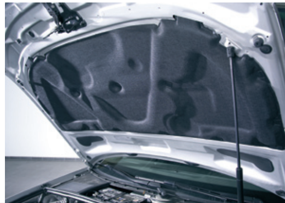
Eine der vielen Anwendungen für Thermoflex-Schaumstoffe: Schallschutz in der Frontklappe.