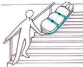
Rettung über Treppenhaus