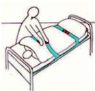
Fixieren der Patienten