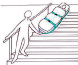
Rettung über Treppenhaus