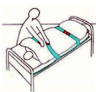
Fixieren der Patienten