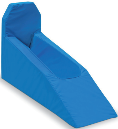
Beinschiene 1 Polyurethan beschichtet 750x250x480mm