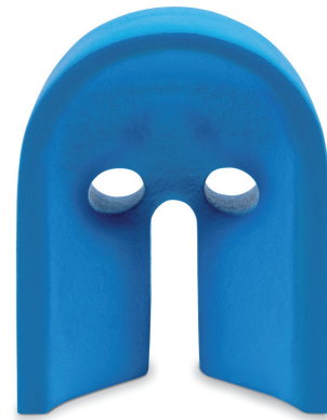
Kopfform für die Bauchlage Abmessung: 280x225x120 mm